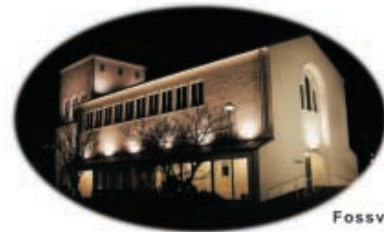
Fossvogskirkja í Reykjavík