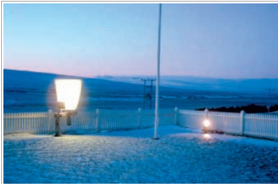
Lampinn er frá ítalska framleiðandanum iGuzzini og heitir „Nuvola“, umboðsaðili GH heildverslun í Garðabæ.

Ekki er um beina lýsingu að ræða úr ljóskösturum á kirkju, heldur er köstur-unum beint að hlemmum sem endurkasta svo ljósinu á kirkjuna. Guðjón segir það hafa verið tilviljun hvernig lýsingin varð til: „Við vorum í Hjarðarholti ásamt heimamönnum að gera tilraunir með lýsinguna og vorum með nokkra kastara. Kastararnir eru þannig að þeir eru tölu-