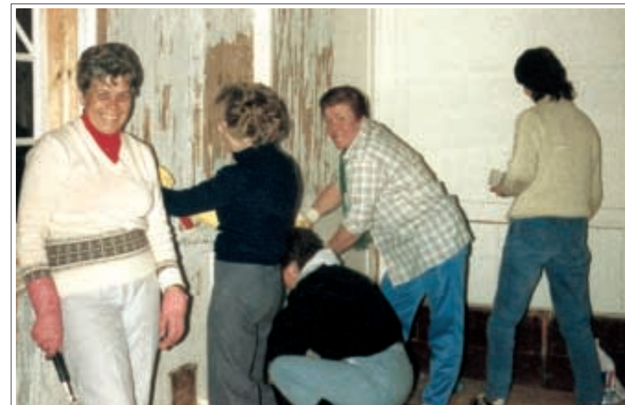
Kvenfélagskonur í sjálfboðavinnu í kirkjunni árið 1988.