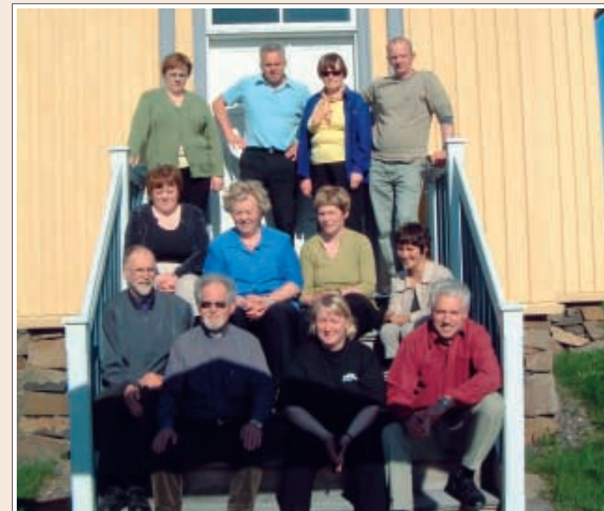
Þátttakendur á námskeiði fyrir umsjónarfólk kirkjugarða á Austurlandi.