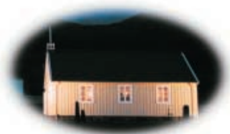
Kolfreyjustaðir við Fáskrúðsfjörð

Við þökkum kirkjum og söfnuðum viðsvegar um landið fyrir gott samstarf.