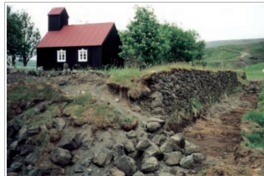
Hlöðnu gardarnir fóru illa í jarðskjálftunum árið 2000.