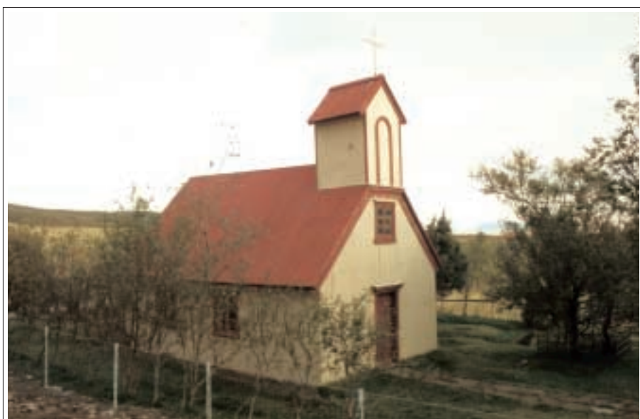
Miðdalskirkja árið 1984 áður en framkvæmdir hófust. Hér er kirkjan járnklædd og ljósmáluð.