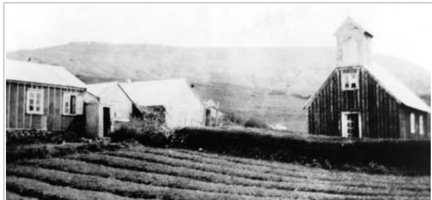
Miðdalur um 1920.