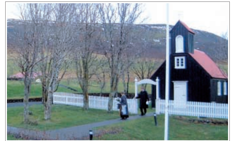
Kirkjustaðurinn í Miðdal sl. haust. Aðkoman og umhverfi allt orðið stórglæsilegt.