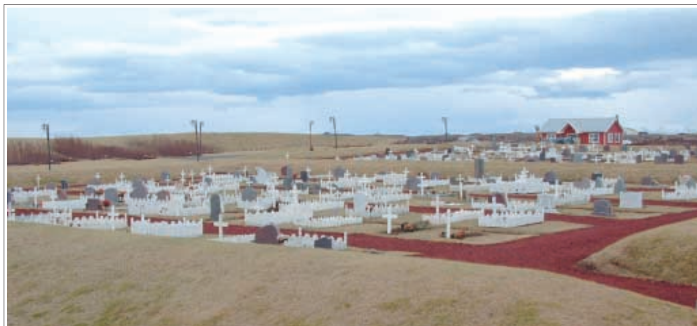
Séð yfir einn reitanna í garðinum. Þarna sést vel hið „sér-keflvíska“ vandamál, ramar og girðingar utan um leiðin sem óneitanlega breyta heildarmynd garðsins.