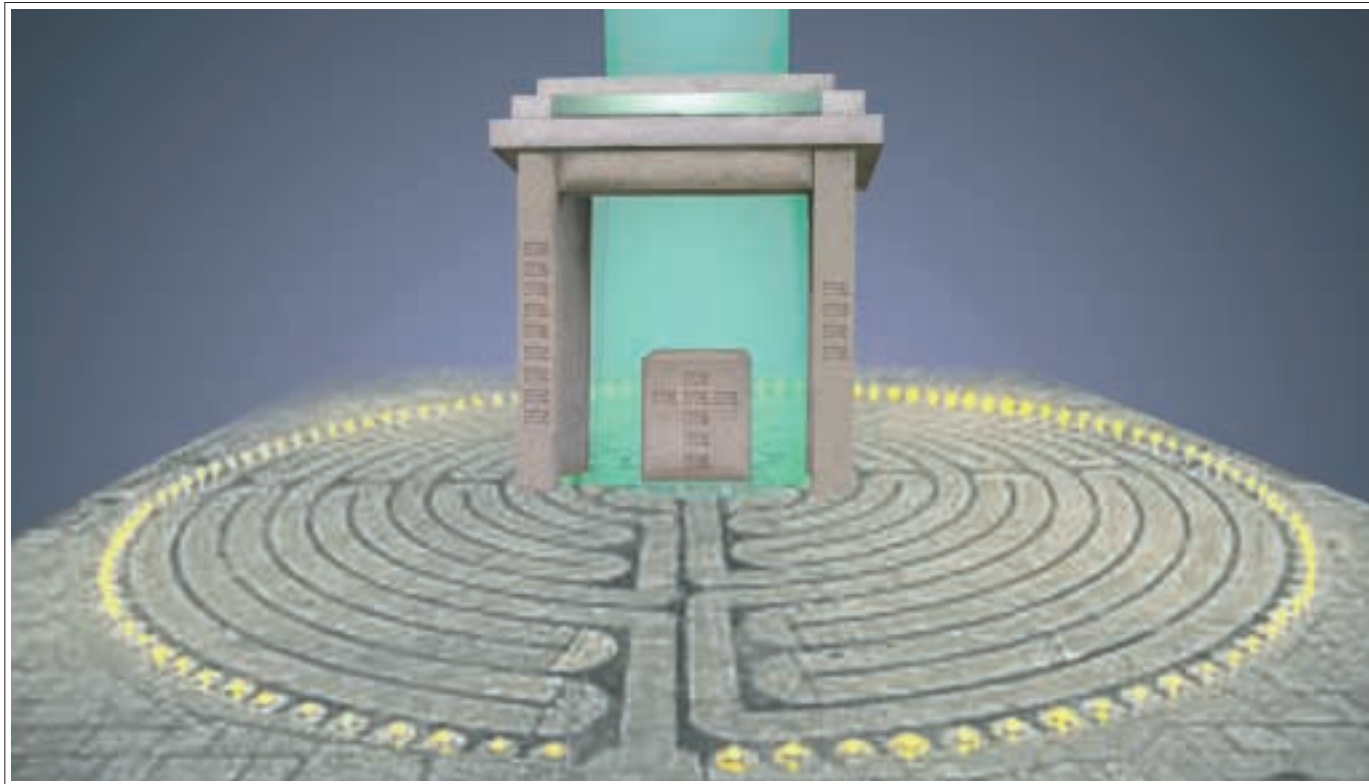
Tillaga að verðlaunaverkinu „Hlið“ eftir Rúrí.