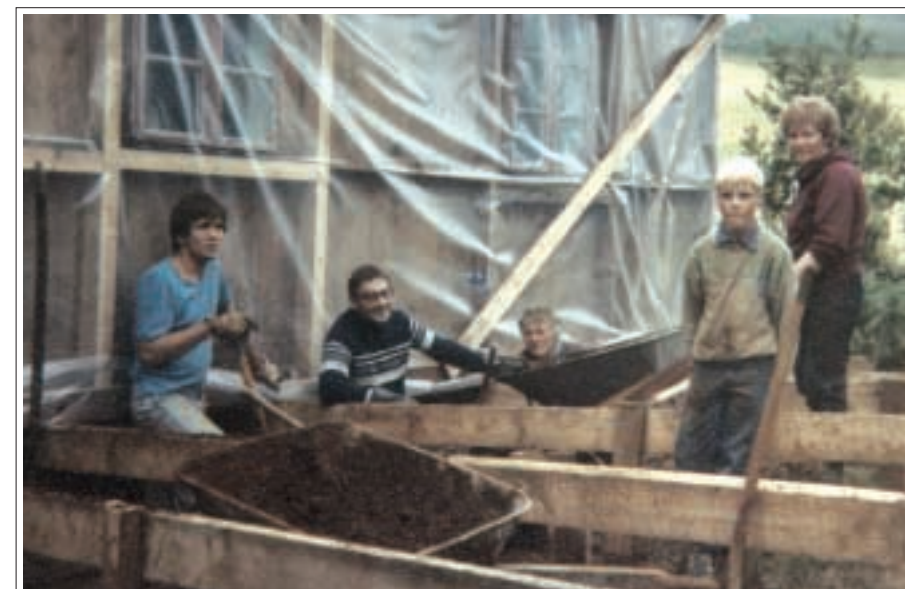
Framkvæmdir hafnar, verið að grafa frá kirkjunni og búið að rífa klæðninguna af.