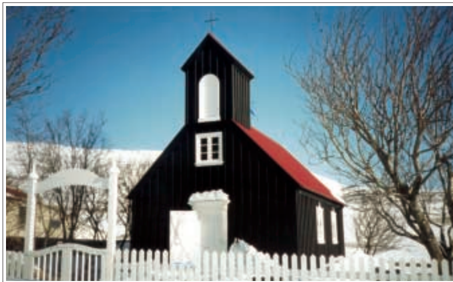
Kirkjan árið 1993 orðin hin glæsilegasta og gjörbreytt í útliti.

Gissur biskup sá er annar var biskup í Skálaholti lét reisa kirkju á Ketilvöllum í Laugardal í Árnassýslu og stóð hún þar lengi. Þar sér enn til kirkjugarðsins. Síðan var hún flutt að Miðdal og er þar síðan. Laugdælir segja þessa sögu um kirkjuflutninginn: