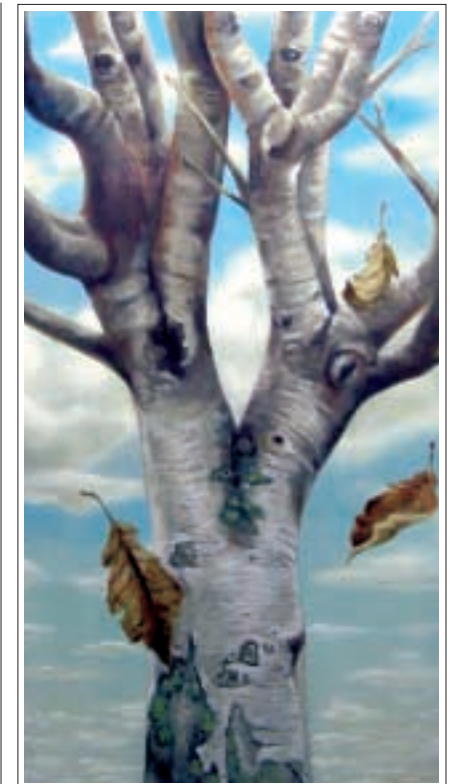
Portrett af reynitré.

mjög áhugaverð, litur þeirra, áferð og vaxtarlag. Einnig finnst mér eitthvað fallegt við þá hugmynd að tré sem vaxa í kirkjugarði séu eins konar táknmynd þeirra sem í garðinum hvíla, jafnvel umbreytt portrett. Engin tvö tré eru eins og bera með sér ólíka „karakter“ en það er einmitt „karakterinn“ eða þetta einstaka sem ég vil fanga,“ segir þessi hæfileikaríki listamaður að lokum og eins og myndirnar hans sýna er hægt að mála