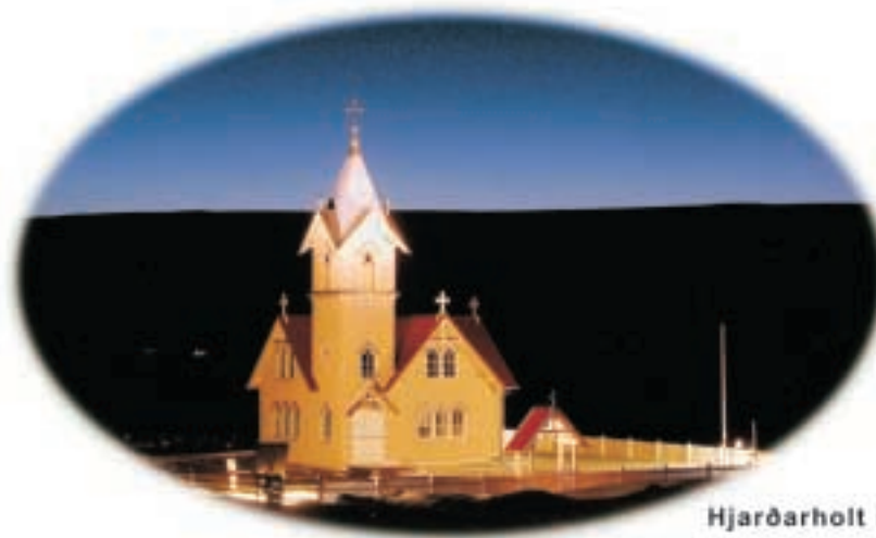
Hjarðarholt í Dölum