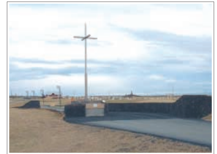
Hið sérstaka sálhlið. Fjögurra arma krossinn rís í 10,75 m hæð.

vandamál, en það er sú hefð sem virðist hafa skapast í garðinum fyrir því að setja upp smágirðingar eða ramma í kringum leiðin, þrátt fyrir að slíkt sé ekki leyfilegt. „Þetta gerir alla hirðingu á garðinum mjög erfiða og brýtur auk þess upp heildarmyndina sem annars væri mun snyrtilegri og fallegru. Við höfum nú ekki gengið svo langt að rífa þessa ramma upp, en það er alveg ljóst að við munum ekki leyfa þá í nýju reitunum þegar þeir verða teknir í notkun. Annað stórvandamál við hirðinguna er hvíta mölin svokallaða sem margir hafa sett á leiðin. „Hún er stórhættuleg þegar unnið er með sláttuorfi við leiðin og við höfum lent í því að fólk hefur slasað sig þegar stykki af þessari möl hafa skotist í vinnufólk við slátt og garðyrkju. Svo vill hún dreifast út á göngustígana sem eru úr rauðamöl og það skapar enn meiri vinnu við hirðinguna.“