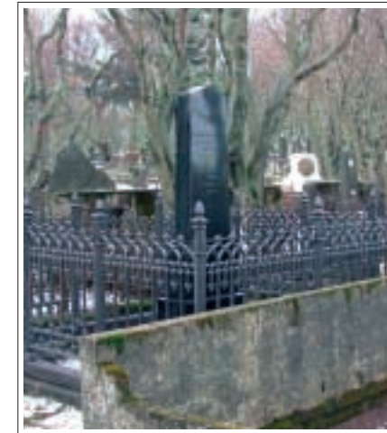
Úr kirkjugarðinum við Suðurgötu.