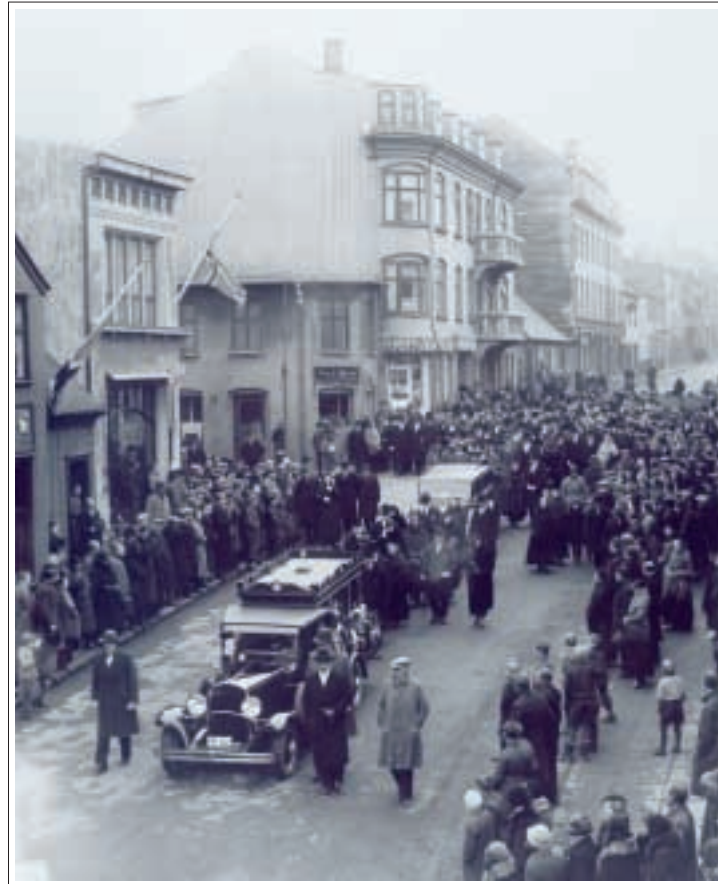
Frá útför Jóns Þorlákssonar borgarstjóra og fyrrum forsætisráðherra 1935.

Skilafrestur tillagna er 23. maí nk. en keppnisgögn fást afhent á skrifstofu Arkitektafélagsins, Engjateigi 9 í Reykjavík.