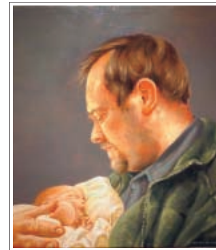
Sjálfsmynd af listamanninum með nýfædda dóttur sína.