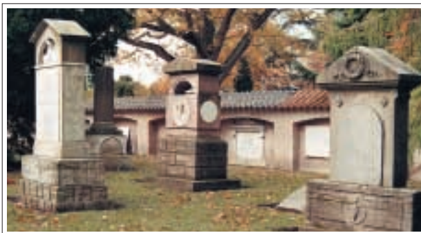
Assistens kirkjugarðurinn í Kaupmannahöfn.

Von er á góðri heimsókn frá Danmörku, en þann 4. apríl nk. kemur til landsins 15 manna hópur danskra kirkjugarðaforstjóra ásamt mökum. Erindið eru fundahöld, auk þess sem ætlunin er að skoða kirkjugarða í Reykjavík og á Suðurlandi. Hópurinn heimsækir kirkjugarða