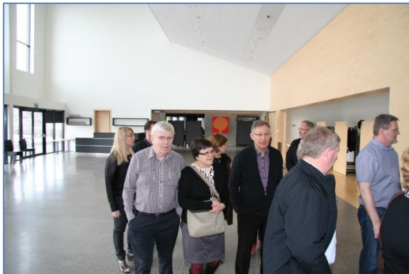
Fundarmenn og makar fóru í skoðunarferð í Hof og fengu þar góða leiðsögn (ARE).

Eftir skoðunarferð í Hof var hópnum ekið upp að bækistöðvum Kirkjugarða Akureyrar og þar voru á borðum góðar veitingar. Nýlega hefur líkhúsið verið stækkað og hagkvæmar breytingar gerðar á húsnæðinu. Gestirnir skoðuðu framkvæmdirnar og er óhætt að segja að sú aðstaða sem þar er nú fyrir hendi er sú besta hér á landi. Dagskráin var fjölbreytt og flutt voru mörg erindi.