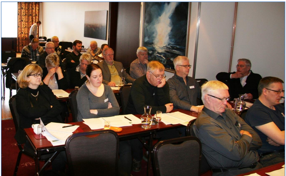
Aðalfundarfulltrúar KGSÍ á Hótel KEA, laugardaginn 12. maí 2013.