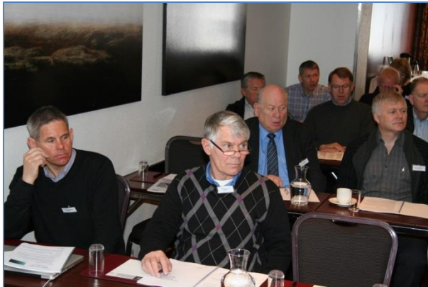
Hluti fundarmanna á aðalfundinum á Hótel KEA (ARE).

Aðalfundur KGSÍ 2013 var haldinn á Hótel KEA á Akureyri laugardaginn 12. maí. Þátttaka var góð, 49 fundarmenn rituðu nöfn sín á nafnalista og við kvöldverðarborðið var heildartala með mökum 87.