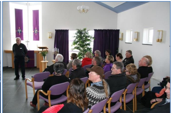
Heimsókn í Höfðakapellu (ARE).